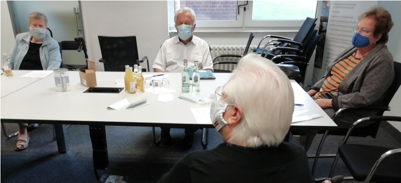
Alle Bilder zeigen die Teilnehmer bei den 2 Gesprächskreisen