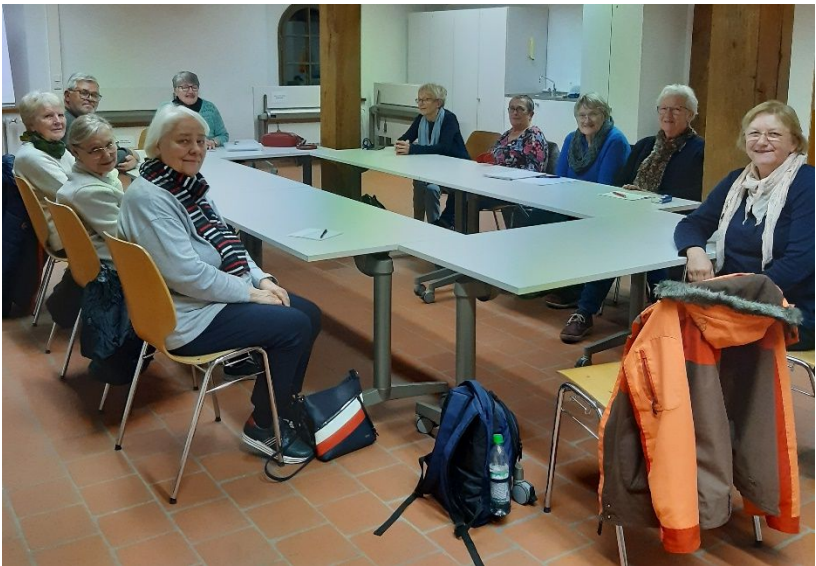
Gruppentreffen in Ingolstadt am 09.01.2023

Eine weitere Frage wurde gestellt, ob bei einer Polyneuropathie (PNP) immer die Nervenleitgeschwindigkeit (NLG) auffällig sei. Manche Ärzte seien der Auffassung, dass es sich nicht um eine PNP handelt, wenn die NLG normale Werte zeigt. Es gibt jedoch Formen der PNP, bei denen die NLG unauffällig ist.