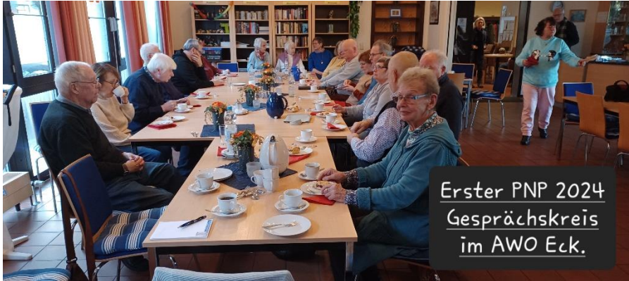
Erster PNP 2024 Gesprächskreis im AWO Eck.

um eine chronische entzündliche Polyneuropathie handelt. Die bisherigen Untersuchungsergebnisse sprechen für CIDP (Chronische Inflammatorische Demyelinisierende Polyneuropathie). Diese lässt sich in der heutigen Zeit doch sehr gut behandeln.