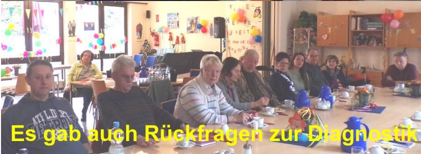
Es gab auch Rückfragen zur Diagnostik