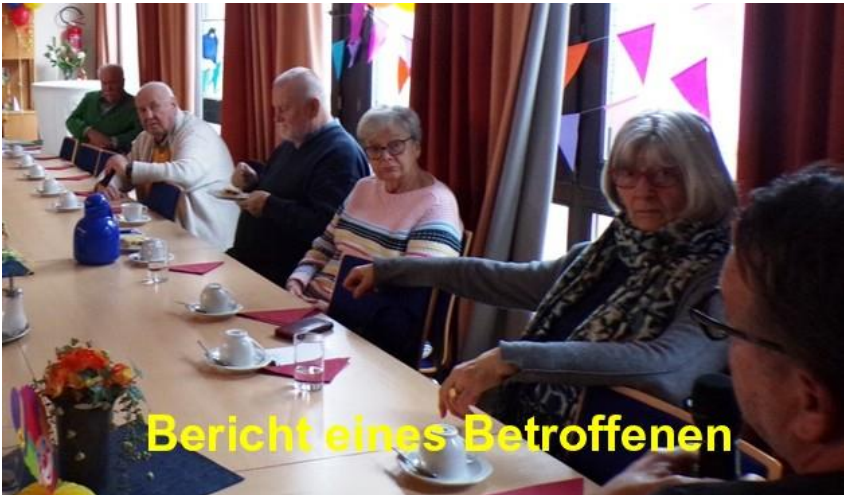
Bericht eines Betroffenen