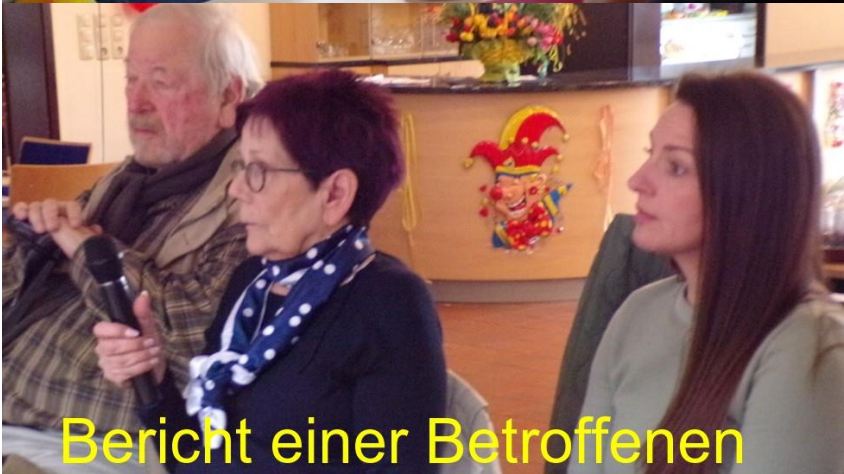
Bericht einer Betroffenen