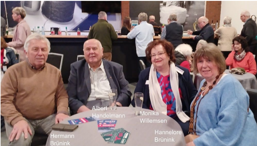
Bild mit Teilnehmern der PNP-Gruppe der Grafschaft Bentheim

Eingebettet in der Reihe weiterer Selbsthilfe Gruppen nahmen Besucher einiges an Informationen und Beratungen mit nach Hause. Insgesamt eine gelungene Abendveranstaltung.