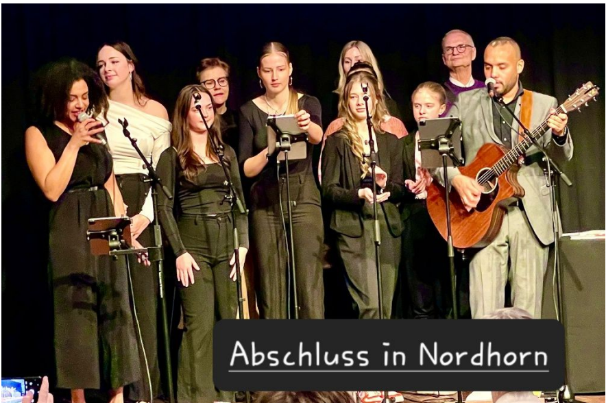
Zum Abschluss bekamen die Künstler großen Beifall.

Eingebettet in der Reihe weiterer Selbsthilfe Gruppen nahmen Besucher einiges an Informationen und Beratungen mit nach Hause. Insgesamt eine gelungene Abendveranstaltung.