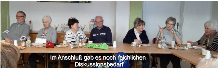
im Anschluß gab es noch reichlichen Diskussionsbedarf

umhüllen, schon einmal aufgefallen. Faszien hüllen auch beim Menschen die Muskeln ein und erlauben es, einzelne Muskeln voneinander abzugrenzen. Eine überragende Rolle spielen Faszien bei der Krafterzeugung. Faszien erzeugen durch Dehnspannung Kräfte und leiten diese im Körper weiter. Muskeln verstärken die